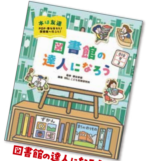
図書館の達人になろう